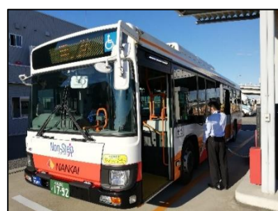
★路線バス (関西空港駅~貨物地区等を走行)