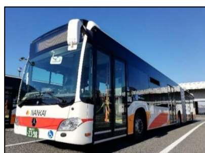
★連節バス (関西空港ターミナル間を走行)