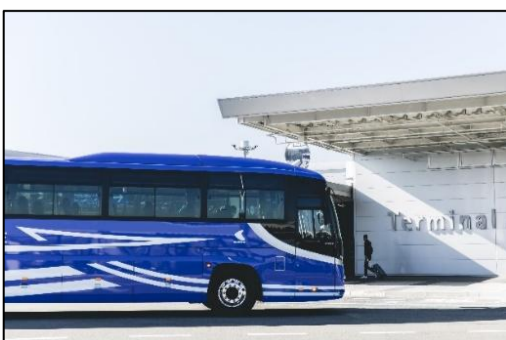
★関西空港リムジンバス・路線バス